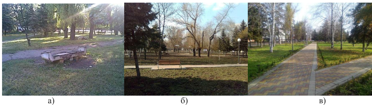
Рис. 2. Этапы реконструкции тематического парка «Марьяна Роцца».

По данным фотографиям можно проводить психологические исследования, эксперименты на тему: «Окружающая среда и позитивный настрой населения»: а) – плохое самочувствие; б) – среднее; в) – позитивный настрой, творческое вдохновение.