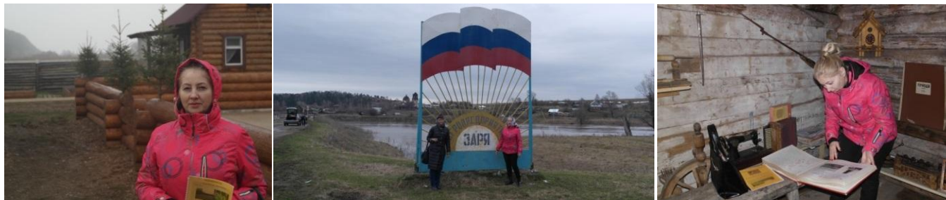
Рис. 3 «Марьян Утес» – знаковое место съемок знаменитого фильма «Тени исчезают в полдень». Кунгурская лесостепь, п. Ленск, Пермский край. 2016 г.

только в роще мы находим спасение и отраду. «Марьяна Роща» – это самое желанное и красивое место в нашем сельском поселение Целина.