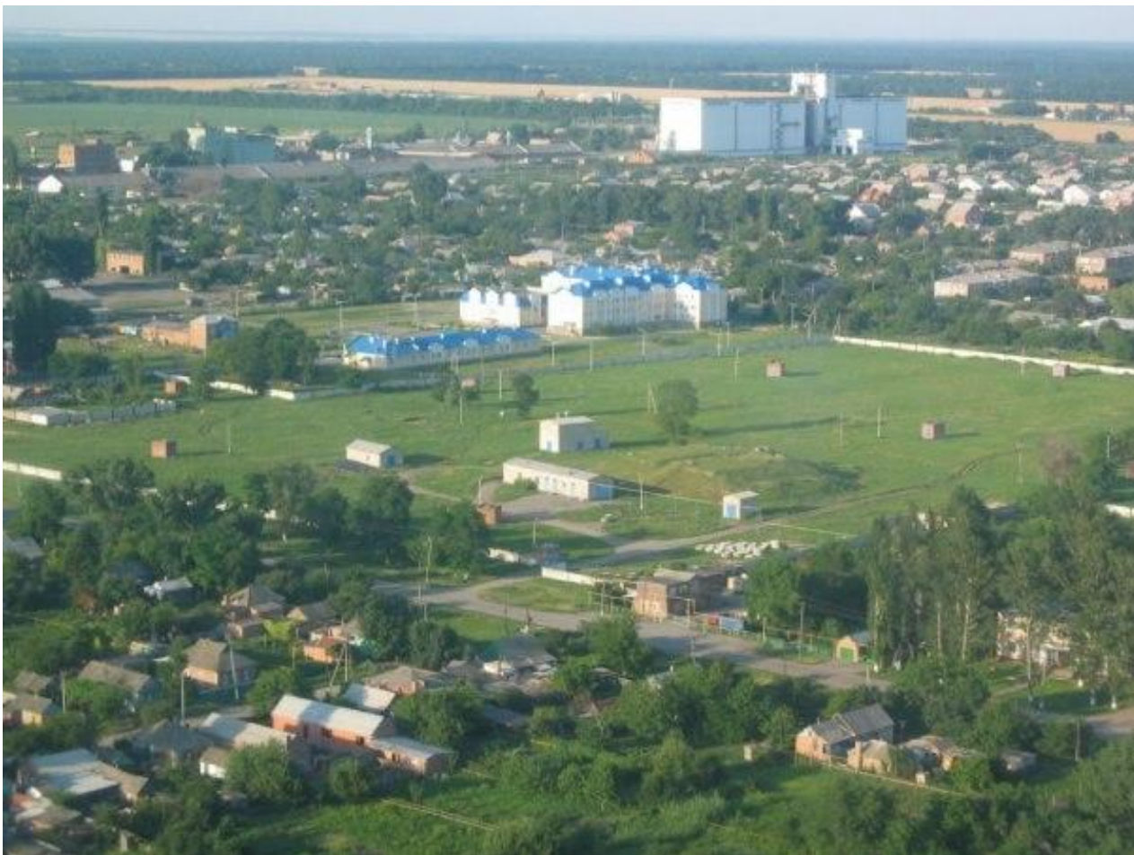
Рис. 1. Поселок Целина. Вид с высоты птичьего полета. 2016 г.

«Веками хранилась особая первозданная красота Донского края в маленьком уголке Сальской степи». Поселок Целина – административный центр Целинского района, Ростовской области. Численность – 12 тысяч человек. Площадь – 10,3 кв. километров. Всю свою историю, от начала прошлого века, производственный потенциал Целинского района развивался, исходя из специализации расположенных на его территории хозяйств, задачей которых было вырастить урожай и отправить на переработку за пределы района.