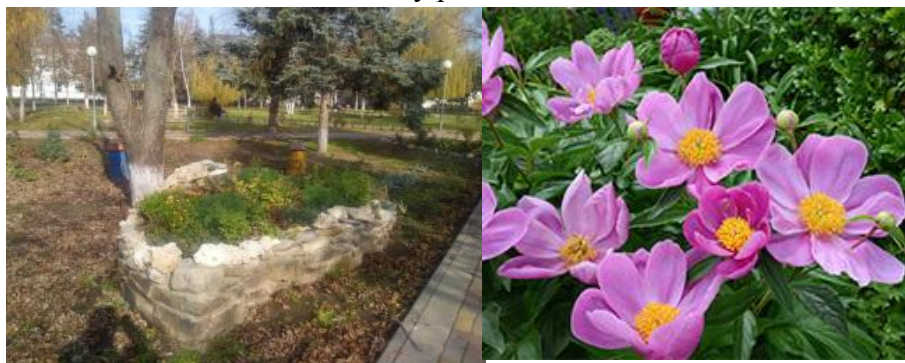
Рис. 5. Вид парка «Марьино Роцца» после реконструкции.

В рыночной экономике, на фоне огромного предложения, при равных конкурентных преимуществах, положительные эмоции выходят на первый план. Люди начинают инвестировать в чувства, в любовь и преданность своей Малой Родине. «Родные», местные названия становятся более привлекательными для населения, а значит и для потребителя [9]. Развивая проект «Марьино Роцца» мы тем самым смогли повысить привлекательность территории – инвестиционную, туристическую и для будущих специалистов сельского хозяйства. И уже откликнулся внешний инвестор – ЗАО «Международная сахарная корпорация», которая будет строить в Целине первый и пока единственный в Ростовской области сахарный завод. Развитие этого проекта даст нам порядка 600 новых рабочих мест, а также мощный толчок экономическому развитию [12].