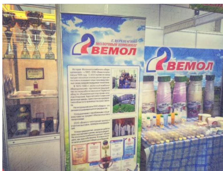
Ил.3 Участие агрохозяйства «ВЕМОЛ» на межрегиональном форуме

На пермском рынке молочной продукции ООО «ВЕМОЛ» можно отнести к группе лидеров. Предприятие занимает 12,2 доли рынка и единственное в крае производит сухое